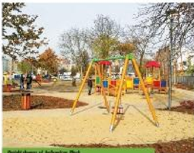
Projekt placu ul. Juchowicza, Płock

– Na pewno projekt zielonej wieży w nowoczesnego, stylowego, a równocześnie ekologicznego budynku Casen Wings w Warszawie oraz jego otoczenia. Zadanie to okazało się prawdziwym wyzwaniem ze względu na ograniczoną przestrzeń przeznaczoną pod rośliny, walczenie w przeważającej części teren, jak również ze względu na fakt, że pod większą częścią obszaru zagospodarowania znajdują się garaże podziemne, a to oznacza roślinność sadzoną na stropie, co z kolei wiąże się z niewysoką warstwą substratu glebowego. W związku z tym zastosowaliśmy gatunki niewymagające dużej ilości ziemi, a w przy-