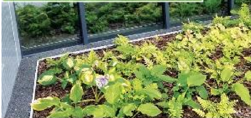
Projekt obiektu, Gerni Mięta, Warszawa

Na ile praca z naturalną przestrzenią i ukształtowana natura pozwala uruchomić wodze wyobraźni? Co najbardziej hamuje innowację architekta krajoznawcy w realizacji konkretnych projektów?